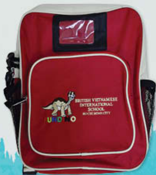
School bag Balo

Giày phải vừa vặn và ôm trọn chân học sinh, có thể mang dép, nhưng phải có quai hậu. Vui lòng tránh mang dép xỏ ngón. Các em không được phép mang giày có đế cao.