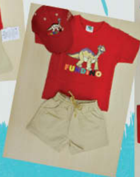
Uniform | Đồng phục School's hat | Nón đồng phục