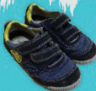
Indoor shoes Giày mang trong nhà