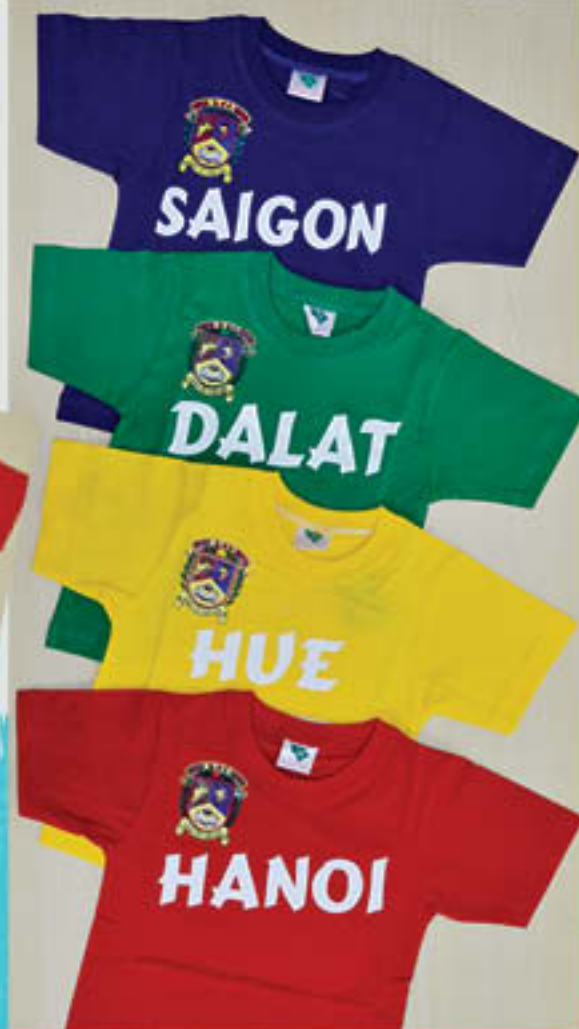
House T-shirt | Áo lớp