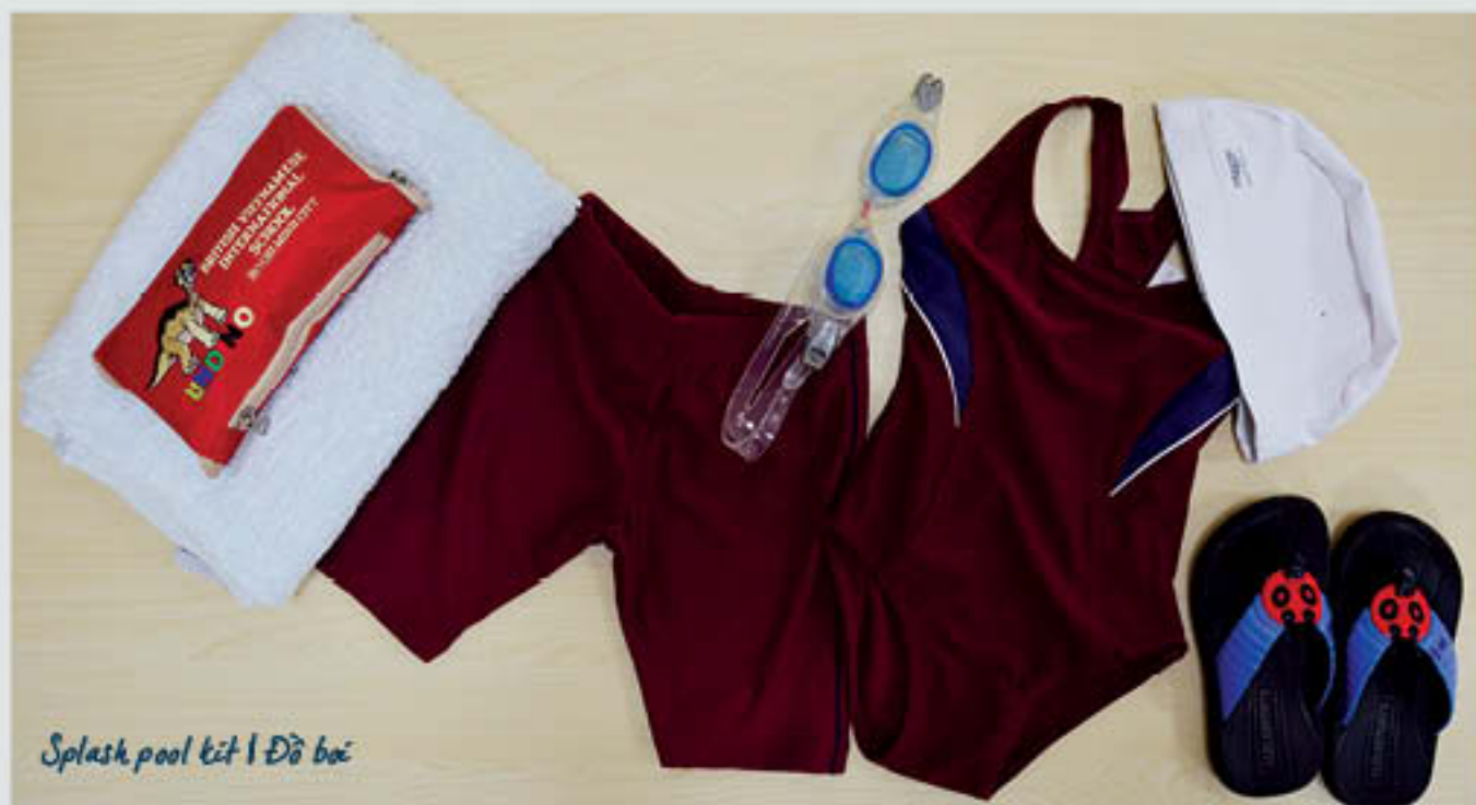
Splash pool kit | Đồ bơi