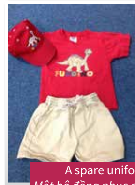
A spare uniform Một bộ đồng phục dự phòng

Sometimes learning and having fun can be messy. So, a spare uniform may be needed. Đôi lúc các em có thể bị vấy bẩn trong lúc học tập và vui chơi. Do đó, một bộ đồng phục dự phòng sẽ rất hữu ích.