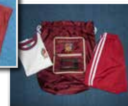
Swimming / PE Kit (towel and swimming costume) Đồ bơi/Đồng phục thể dục (khăn tắm và đồ bơi)

This should be brought during your child's swimming/splash pool session. Cần chuẩn bị đồ bơi cho con mang đến trường khi có giờ bơi.