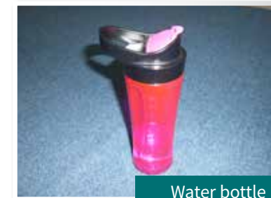
Water bottle Bình nước

This should be brought during your child's swimming/splash pool session. Cần chuẩn bị đồ bơi cho con mang đến trường khi có giờ bơi.