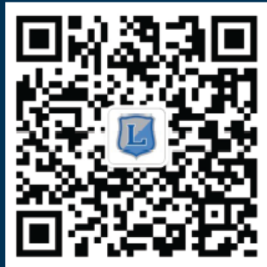
订阅号 Official Account